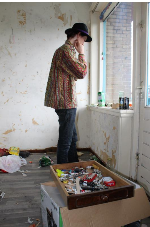
De persoon op de foto is niet 'Marleen' en/of haar zoon.