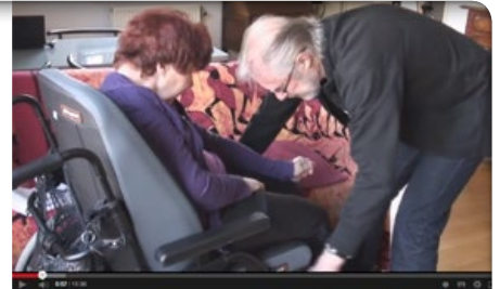
Even nu adem komen: intensieve mantelzorg volhouden

Het Platform Mantelzorg Amsterdam heeft – in alle bescheidenheid – een prachtige film gemaakt over respijtzorg. De film, waarin vier mantelzorgers in beeld zijn, is te zien via http://youtu.be/Z6pekH6dDDE ●