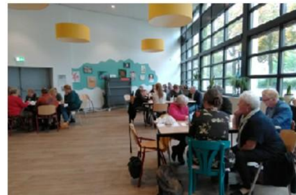
Bijeenkomst in stadsdeel Noord