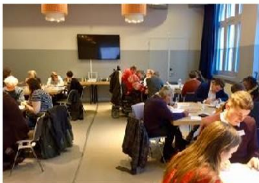
Bijeenkomst in stadsdeel Oost

Handhaving van de regelgeving is belangrijk om Amsterdam toegankelijk te maken. Dit betekent dat de handhaving van afspraken van de openbare ruimte aangescherpt mag worden, zodat gebouwen, trottoirs, fietsenstallingen vrij toegankelijk zijn voor mensen met een beperking en met eventuele hulpmiddelen (zoals een rolstoel, blindenstok of een scootmobiel). Dit houdt bijvoorbeeld in dat gebouwen ook toegankelijk zijn voor mensen met zintuigelijke beperkingen, er geen drempels zijn, het toegankelijk is voor (elektrische) rolstoelen en er ringleiding en ondertiteling aanwezig is.