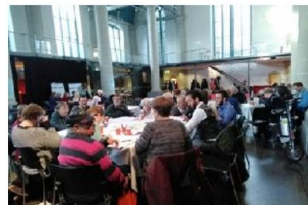
Slotbijeenkomst 12 november