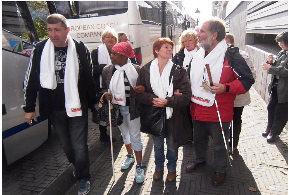
Met een volle bus was Cliëntenbelang goed vertegenwoordigd op de landelijke actiedag in Den Haag op 19 september. Hier een deel van de delegatie in actie-outfit.